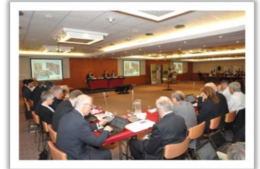
Şekil 2: 2016 Yılı Genel Kurulu Fotoğrafları