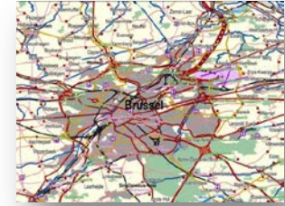
Şekil 5: ERM Örnek Veri

EuroRegionalMap(ERM): Avrupa'ya ait 1:250.000 ölçekli topografik harita veri kümesidir. Kartografik ürünlerin oluşturulmasıyla birlikte konumsal analiz için de kullanılabilir(Şekil 5).