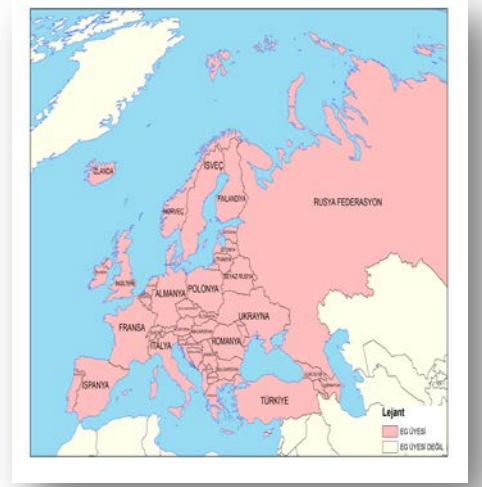
Şekil 1: EG Üye Ülkeler

EG; yılda 1 Genel Kurul, 1 Olağanüstü Genel Kurul, 1 Üreticiler Teknik Toplantısı, gerektiği kadar Bilgi Değişim Ağları (Knowledge Exchange Network-KEN) Toplantısı yapmaktadır.