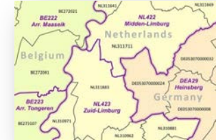
Şekil 7: EBM Örnek Veri

EuroBoundaryMap(EBM): 1 :100.000 ölçekli mülki idari ve istatistik bölge sınırlarını içeren ve halihazırda 43 ülkeyi kapsayan coğrafi veri tabanıdır (Şekil 7).