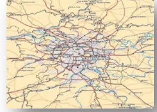
Şekil 4: EGM Örnek Veri

EuroGlobalMap(EGM): Avrupa'da 45 ülkeyi kapsayan 1:1.000.000 ölçekli topografik veri kümesidir. İdari bölümlere, hidrografik ağlar, ulaşım ve yerleşim yerlerini içermektedir. Ücretsiz olarak indirilebilmektedir(Şekil 4).