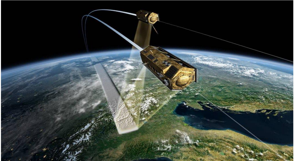
TerraSAR-X ve TanDEM-X Uyduları

TREx, Almanya Havacılık ve Uzay Ajansı (Deutsche Zentrum für Luft und Raumfahrt, DLR) tarafından işletilmekte olan TerraSAR-X ve TanDEM-X adlı iki radar uydusundan elde edilen Sayısal Yüzey Modeli (SYM) verisinin işlenerek içerdiği hataların ayıklanmasını amaçlamaktadır.